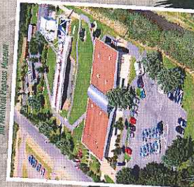
Mémorial Pegasus The Mémorial Pegasus Museum

Sherman tanks of the 3rd British Infantry Division carried the military to the front.